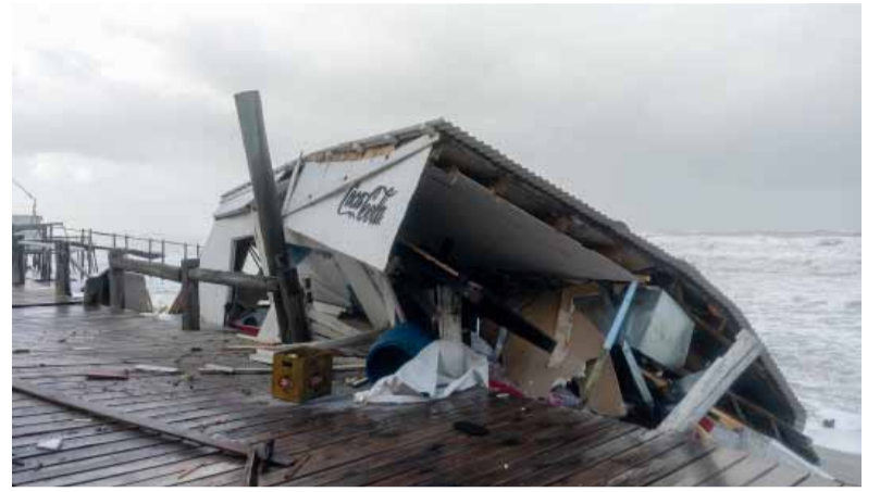
Temporal. La prioridad inmediata será recuperar la masa de arena que históricamente protegía la costa.