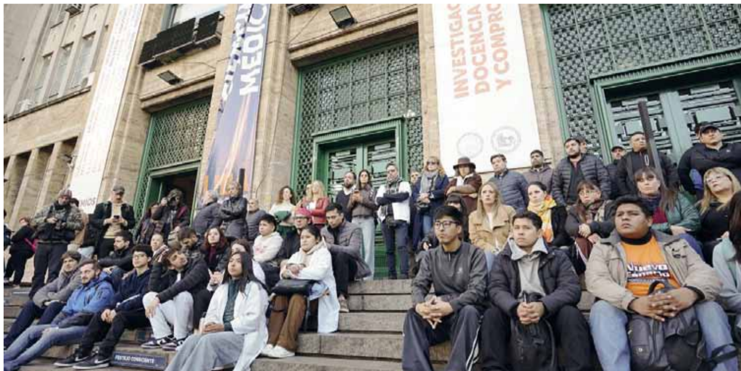
■ A horas de la movilización, la Universidad de Buenos Aires (UBA) organizó ayer una serie de clases públicas en distintas facultades.

Fitch y ante la posibilidad de que Moody's también revise la nota de la deuda argentina antes de julio. El presidente Javier Milei celebró en redes sociales y aseguró que "todo marcha de acuerdo al plan". Página 2