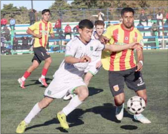
Escena del mano a mano entre Embajadores y Bull Dog.

En la jornada decisiva, con partidos pertenecientes a la quinta fecha, se conocieron todos los clasificados y entre éstos hay tres representantes de la Liga de Bolívar.