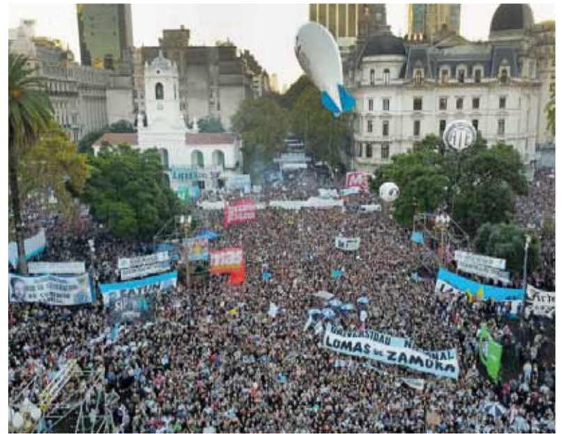
Reclamo. Hoy habrá marchas y movilizaciones en todas las provincias del país.

El Plenario de la Federación Nacional de Docentes Universitarios (Conadu) se reunió el vier-