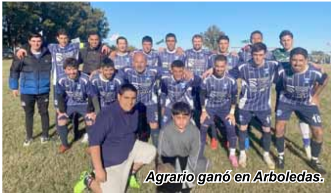
Agrario ganó en Arboledas.