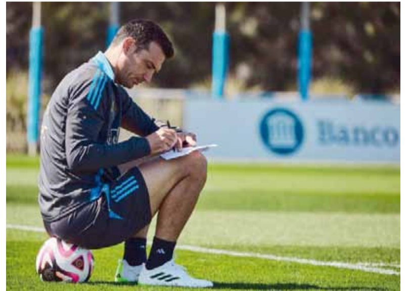
Polémica. Scaloni presentó una nómina que despertó controversia.