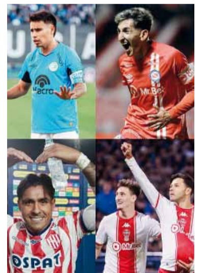
Ilusión. Cuatro sueños y dos boletos en juego.

Con equipos en alza, estadios repletos y el pase a semifinales en juego, el Torneo Apertura comenzará una etapa en la que cada error puede resultar definitivo. La paridad mostrada hasta ahora sugiere que los detalles tácticos y la resistencia física serán los jueces de una jornada que promete mantener a los hinchas al borde del asiento hasta el último minuto del tiempo suplementario.