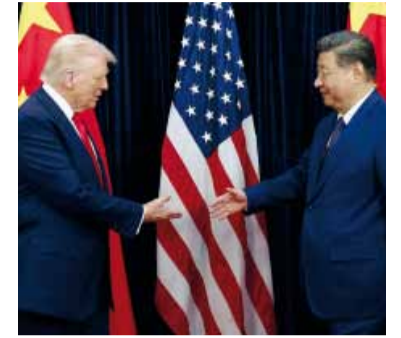
Taiwán, comercio y negocios: los ejes de una cumbre decisiva.

China y EE.UU. intentarán bajar las tensiones