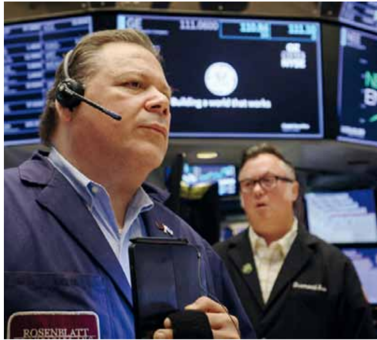
A la baja. Se confirmó la tendencia que se inició la semana pasada tras la mejora en la calificación de la agencia Fitch.

Lo posteó al hacer referencia a un tuit previo del economista Felipe Núñez que destacaba que el Riesgo País estaba perforando el piso de los 500 puntos. No su-