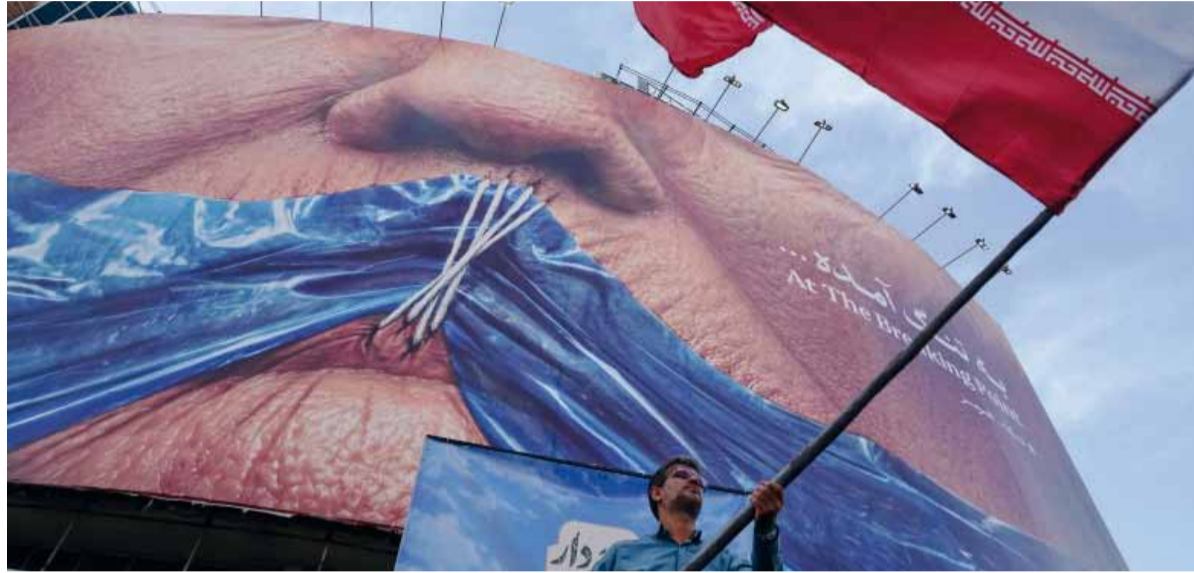
Respiración asistida. Así definió el mandatario el momento que atraviesa la tregua con Teherán.

Trump señaló que la reacción iraní le produjo la sensación de que las conversaciones se habían convertido en una pérdida de tiempo. Afirmó que Teherán pretende negociar, pero que la propuesta presentada es “estúpida” e inaceptable para Estados Unidos. En ese sentido, volvió a contrastar su postura con la del expresidente Barack Obama, a quien acusó de haber sido el único capaz de aceptar un